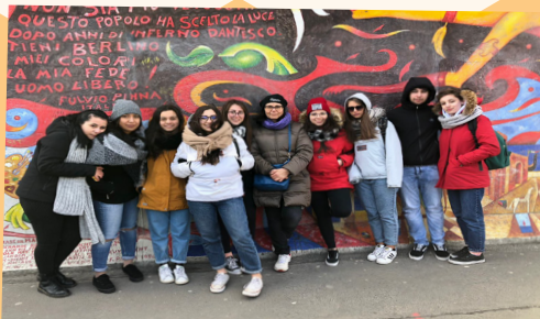
Scambio culturale a Berlino