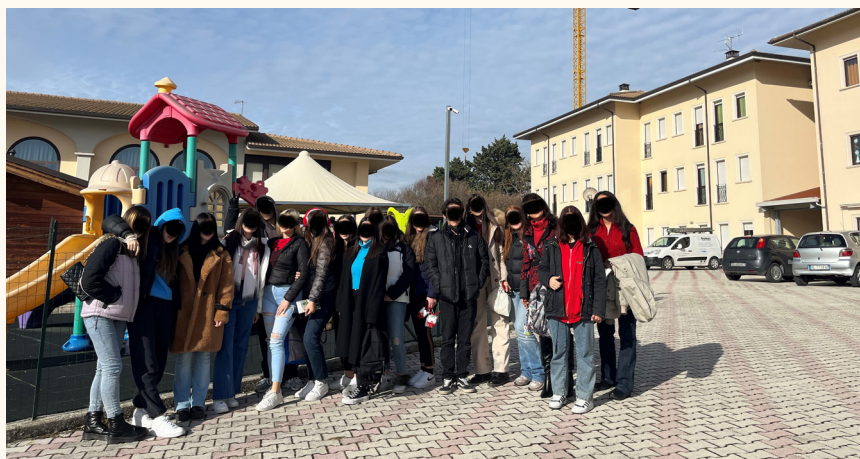
Visita guidata presso la Casa Madre e Bambino e Comunità Educativa in San Gregorio

N.B. Nel quinto anno è impartito l'insegnamento, in lingua straniera, di una disciplina non linguistica (CLIL), compresa nell'area delle attività e degli insegnamenti obbligatori.