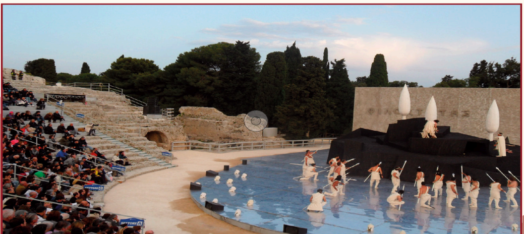
Rappresentazione teatrale a Siracusa