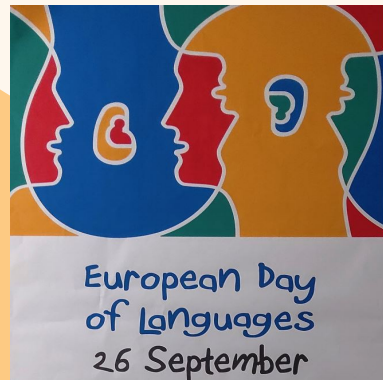
Giornata Europea delle lingue