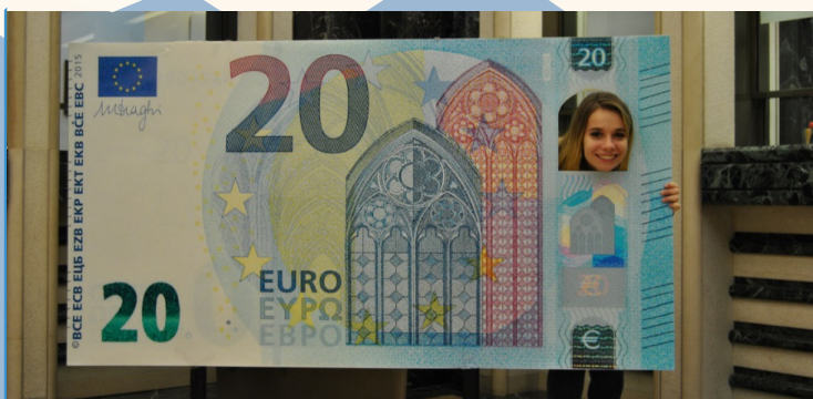
La giornata della Banconota - Banca d'Italia, L'Aquila