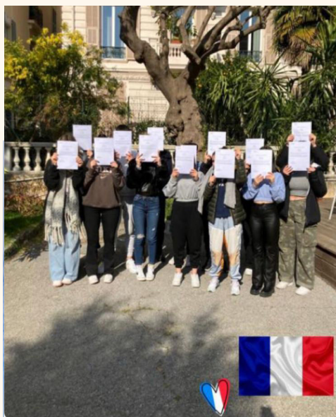
Stage a Nizza