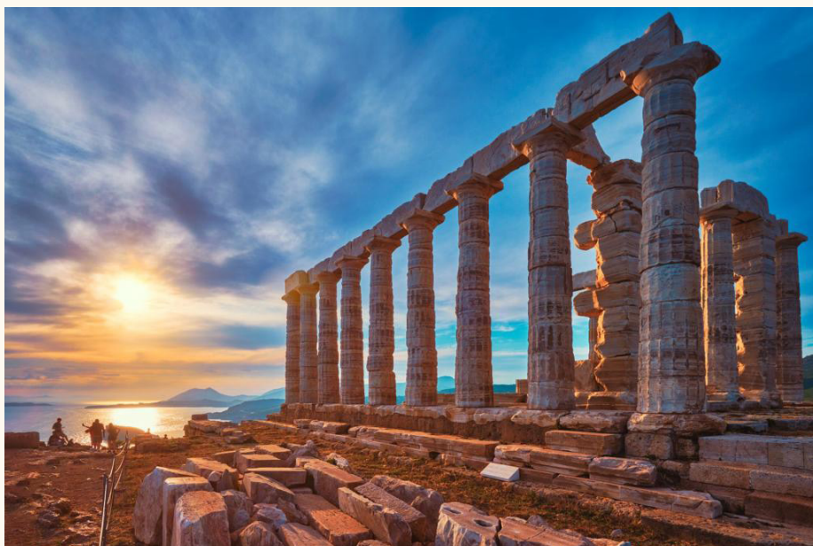
Capo Sunion - Tempio di Poseidone (Viaggio di istruzione in Grecia).

* Un'ora in più a settimana sia di matematica che di scienze per tutti e cinque gli anni di corso rispetto al Liceo Classico tradizionale.