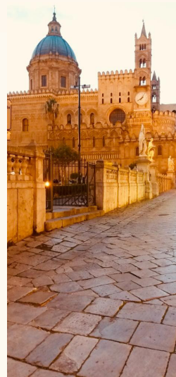
Viaggio della legalità a Palermo Cattedrale