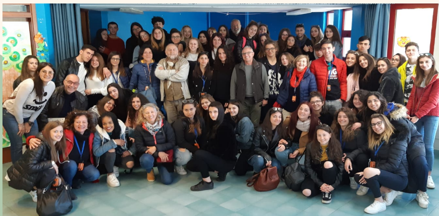
Viaggio a Palermo - Cooperativa Solidaria