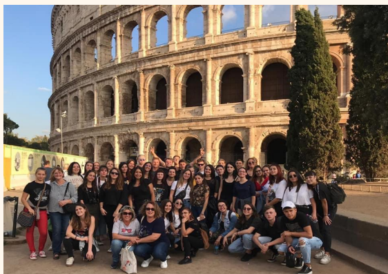
Scambio culturale con l'Ungheria

N.B. In terzo anno è previsto l'insegnamento in lingua straniera di una disciplina curricularere non linguistica (CLIL). Nel quarto e nel quinto anno sono svolti due insegnamenti CLIL.