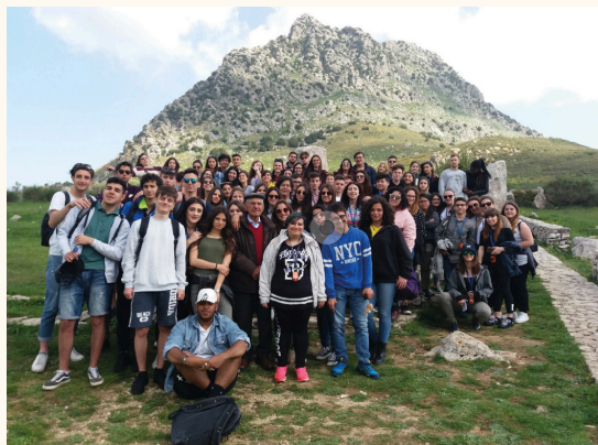
Viaggio della legalità a Palermo Memoriale di Portella della Ginestra

N.B. Nel quinto anno è impartito l'insegnamento, in lingua straniera, di una disciplina non linguistica (CLIL), compresa nell'area delle attività e degli insegnamenti obbligatori.