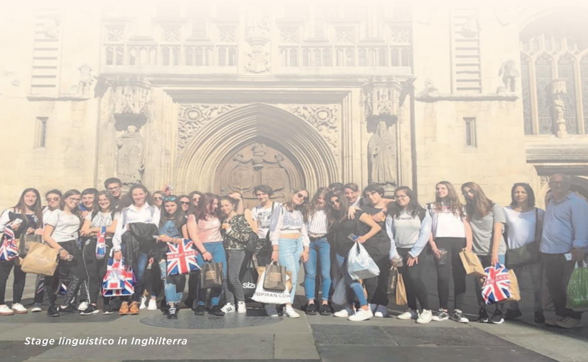
Stage linguistico in Inghilterra

* Ore svolte in compresenza con il docente madrelingua